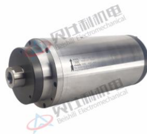
轴承试验机专用电主轴